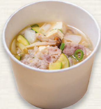
차돌 된장찌개 차ドル味噌チゲ