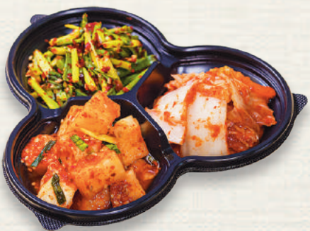
김치 모듬 김치盛り