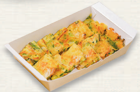
해물 파전 海鮮パジョン